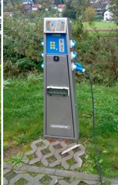
Bild 10 / Parkautomat