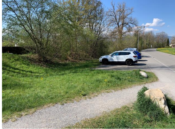
Bild 3 / Parkplatz bei Badi