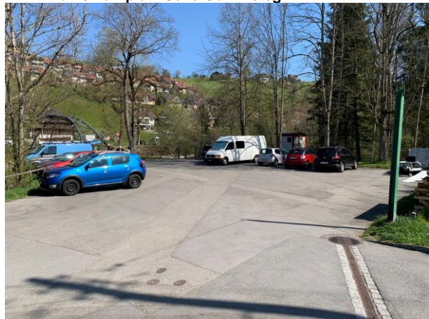
Bild 5 / Parkplatz nach Badi