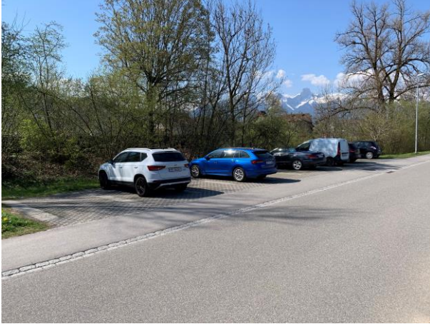
Bild 2 / Parkplatz vor Badi