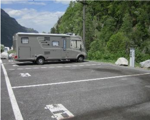
Bild 14 / Stellplatz gegittert