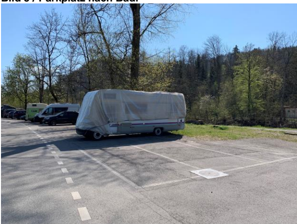
Bild 6 / Parkplatz nach Badi