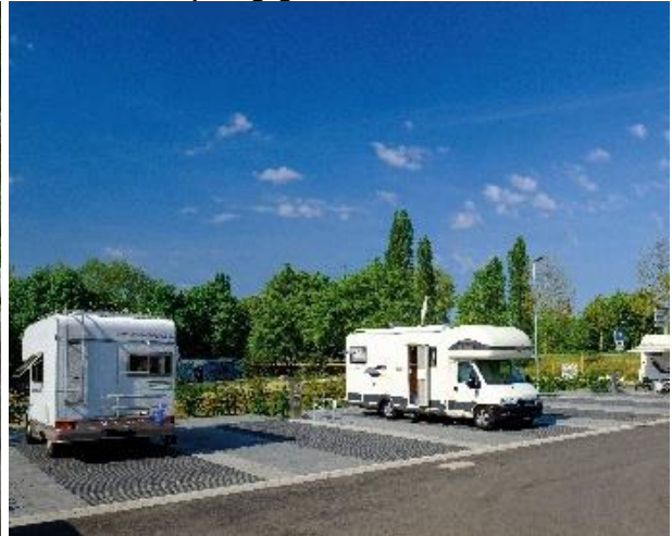
Bild 15 / Stellplatz betoniert