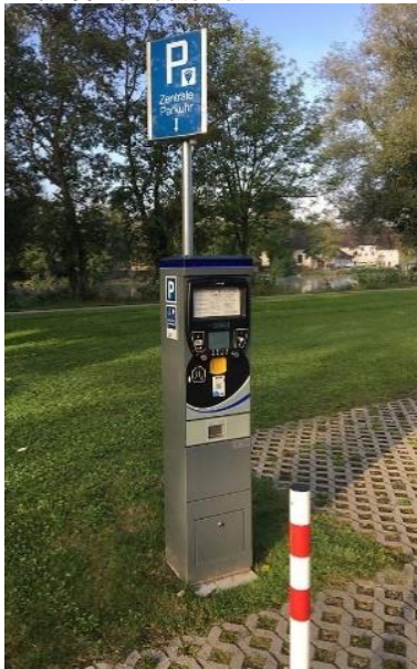
Bild 11 / Parkautomat mit Ver- Entsorgung